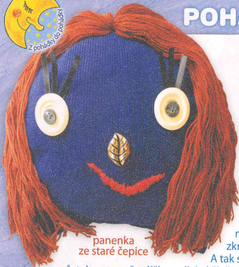
panenka ze staré čepice